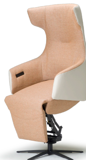
Afgebeeld: NV1005 met voet 87 (combi-stoffering)